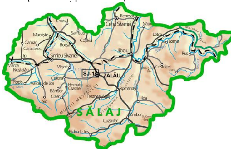
Fig. 1.1 Amplasarea stației de monitorizare a calității aerului, în județul Sălaj.

Calitatea aerului este monitorizată și prin măsurători continue în stația automată de tip fond urban, amplasată pe strada Meteorologiei. Poluanții monitorizați sunt: SO 2 , NO x , CO, O 3 , PM 10 , PM 2,5 alături de parametrii meteo: temperatura, direcția și viteza vântului, radiația solară, presiunea și umiditatea atmosferică.