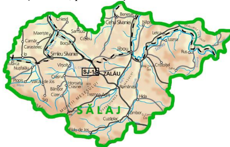
Fig. 1.1 Amplasarea stației de monitorizare a calității aerului, în județul Sălaj.

Calitatea aerului este monitorizată și prin măsurători continue în stația automată de tip fond urban, amplasată pe strada Meteorologiei. Poluanții monitorizați sunt: SO 2 , NO x , CO, O 3 , PM 10 , PM 2,5 alături de parametrii meteo: temperatura, direcția și viteza vântului, radiația solară, presiunea și umiditatea atmosferică.