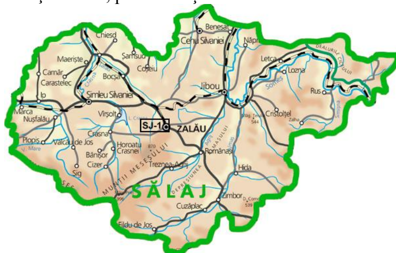
Fig. 1.1 Amplasarea stației de monitorizare a calității aerului, în județul Sălaj.

Calitatea aerului este monitorizată și prin măsurători continue în stația automată de tip industrial, amplasată pe strada Meteorologiei. Poluanții monitorizați sunt: \text{SO}_2 , \text{NO}_x , \text{CO} , \text{O}_3 , \text{PM}_{10} , alături de parametrii meteo: temperatura, direcția și viteza vântului, radiația solară, presiunea și umiditatea atmosferică.